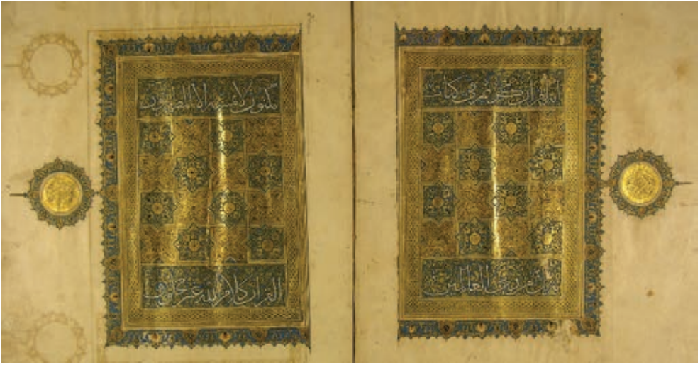
Resim 7. Kur'an cüzü, hattat: Abdullah b. Ebulkasım b. Abdullah el Tuvî er-Rudravârî, Tebriz (?) 1315, TSK, E.H. 248, y. 1b-2a (Atbaş, 2019, fig.9).

Harem'e götürülmüş olduğunu gösterir. 54 yapraklık cüz, siyah muhakkak hatla sayfada beş satır halinde yazılmıştır. 1b-2a yapraklarındaki levha tezhibi, altın ve lacivert rengin hakim olduğu içleri rumi ve palmetlerle doldurulmuş, geçme bantların oluşturduğu geometrik bir tasarıma sahiptir. Bu tasarımı sırasıyla, altın zincirekli ve sarmal rumi ve palmetli bir bordür çevreler. Bu gruba giren bir diğer cüz ise Reşidüddîn'in hazinesi için, muhtemelen Tebriz'de, 1315'te, hattat Abdullah b. Ebulkasım b. Abdullah el-Tuvî er-Rudravârî tarafından istinsah edilmiştir (E.H.248). Bu Kur'an'ın diğer cüzleri günümüze ulaşmamıştır. Ölceytü'nun ölümünden 16 ay önce yazılmış olan eser, vezir olarak Reşidüddîn'in en güçlü olduğu zamana rastlamaktadır. Müzehhibi bilinmeyen eserin, sekiz kollu yıldızlar ve haç biçimleriyle yapılan tezhip tasarımının benzeri İlhanlı dönemi çini panolarında da görülür (Resim 7).