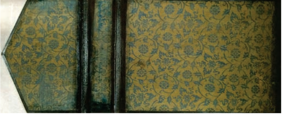
Resim 11. Antoloji 'nin iç kapağı, 1306, TSK, A. 2301 (Atbaş, 2019, fig.13).

Saray'da onarım geçirdiğini düşündürmektedir. 14 Ayrıca Antoloji 'nin ilk ve son yapıklarına basılı Sultan II. Bayezid (1481-1512) mühründen, kitabın en geç bu dönemde Saray hazinesine girmiş olduğu anlaşılmaktadır. 15 Kitabın ilk yaprağındaki Sultan III. Ahmed'in vakıf mührü ise, kitabın III. Ahmed (1703-30) döneminde, Saray'ın kitap hazinesinden çıkarılarak, Sultan'ın kurduğu kütüphaneye vakfedildiğini göstermektedir.