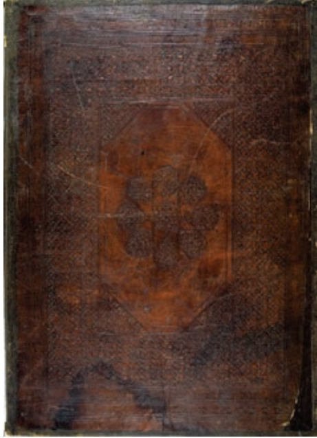
Resim 3. Kur'an cüzünün ön dış kapağı, Musul 1306-7, TSK, E.H. 232 (Atbaş, 2019, fig.5).

İkinci gruba giren eserler ise genellikle 55x40 ya da 50x30cm ölçülerinde, dış kapakları özgün Kur'an cüzlerinden oluşmaktadır. Çeşitli cüzleri günümüze ulaşabilmiş olan bir Kur'an'ın, on beşinci cüzü Ölceytü Hüdabende için hazırlanmıştır (E.H.232). 6 Ali b. Muhammed Zeyd b. Muhammed tarafından Musul'da yazılan cüz 1306-7 tarihlidir. Kahverengi deri ön ve arka dış kapaklar ile mikleb, geçme bant, nokta ve küçük karelerle doldurulmuş dar ve enli bordürlerle çevrilidir. Kapağın ortasındaki dar dikdörtgen alan sekizgene dönüştürülmüş ve bunun ortasına sekiz kollu yıldız ve altıgenlerden oluşan bir şemse yapılmıştır. Ön ve arka kapağın dış bordürüne, üstte ve altta net okunamayan bir söz, yan yana tekrarlanarak kalıpla basılmıştır (Resim 3).