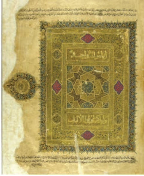
Resim 2. Kur'an cüzü, müzehhip: Muhammed b. Aybek b. Abdullah, Bağdat 1307-8, TSK, E.H. 243, y. 2a (Atbaş, 2019, fig.3).

hatla yazılmıştır. 1b-2a yaprakları levha şeklinde tezhiplidir (Resim 2). Merkeze yerleştirilen dört kollu yıldızın lacivert renk zemini üzerine, altınla kıvrım dallar ve rumiler yapılmıştır. Birbirini kesen geçme bantlarla çeşitli geometrik motifler oluşturulmuş, içleri rumi ve palmetlerle bezenmiştir. Bu alanı sırasıyla zincirekli, dönüşümlü yerleştirilmiş dilimli daire ve beyzi motifli ve yine zincirekli bir bordür kuşatır. Tüm bu alanları en dışta lacivert renkte tıgı, kıvrım dal, rumi ve palmetli bir kuşak çevreler. 4