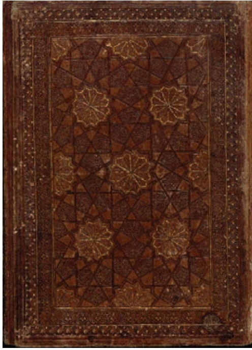
Resim 12. Hadis kitabının ön dış kapağı, Meşâbîhu's-sünne , 1287, TSK, A. 285 (Atbaş, 2019, fig.14).