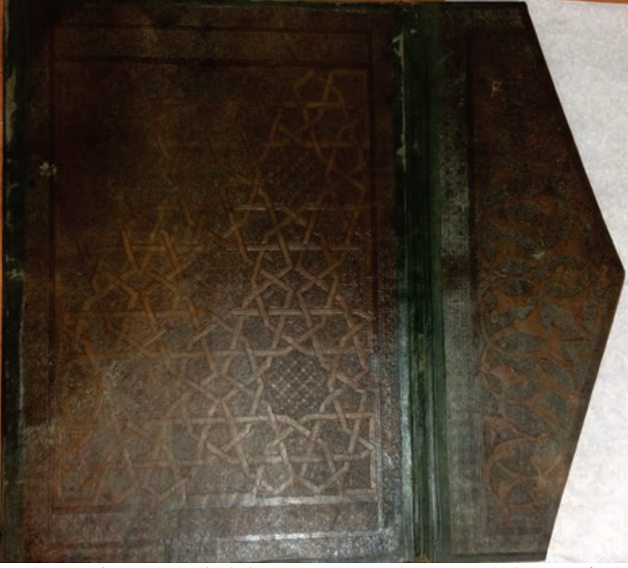
Resim 5. Kur'an cüzününün arka dış kapağı, 1310 civarı, TSK, E.H. 245 (Atbaş, 2019, fig.7).

İç kapaklar blok kalıpla yapılmış sarmal iri rumilerle süslenmiştir. Sayfada üçü altınla ikisi siyahla olmak üzere beş satır halinde muhakkak hatla yazılmış olup 55 yapraktır. 1a yaprağında Sultan III. Osman'ın vakıf mührü basılıdır. 1b-2a yaprakları levha şeklinde tezhiplidir. İçleri palmet ve sarmal rumi motifleriyle doldurulmuş, birbirini kesen geçme bantların oluşturduğu geometrik motifli bir tasarıma sahiptir. Bu tasarımı sırasıyla, altın zincirekli ve sarmal rumi ve palmetli bir bordür çevreler.