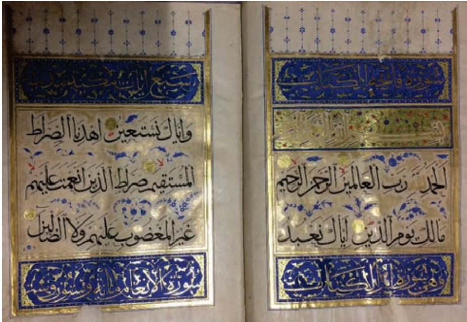
Resim 8. Kur'an cüzü, hattat: Argûn Kâmilî, 1306-7, TSK, E.H. 222, y. 1b-2a (Atbaş, 2019, fig.10).

Saray koleksiyonunda, XIII. ve XIV. yüzyıllarda yaşamış ünlü hattatların hazırladıkları Kur'an ve cüzlerinin, tezhip ve ciltleri, 1555-65 yılları arasında Osmanlı sarayında yenilenmiştir. Üçüncü grubu da bu eserler arasındaki İlhanlı el yazmaları oluşturur. Yâkût el-Mustasimî, Argûn Kâmilî gibi ünlü hattatların istinsah ettiği bu eserlerin bir kısmının kenar sayfaları yenilenmiş, cetveller çekilmiş, sure başları, keleme sayfaları tezhiplenmiştir. Cilt kapakları dönemin üslubunda deri ya da lake kapaklar ile yenilenmiştir. Argûn Kâmilî'nin 1306-7 yılında yazdığı Kur'an cüzünün, cildi ve tezhibi XVI. yüzyılın ikinci yarısında saray nakkaşhanelerinde yenilenmiştir (E.H.222). 34x23cm ölçülerindeki cildi kestane rengi deridir. Dilimli madalyon şemse, salbek, köşebent ve bordürün zemini saz üslubunda bezenmiş ve altınla boyanmıştır. 102 yaprak olup sayfada sülüsle beş satır halinde yazılmıştır. Serlevha tezhibi dikdörtgen formundadır (Resim 8). Sure aralarına yaprak ve çiçekli dallar yapılmış, üst ve alttaki dikdörtgen kartuşlara altınla sure başları yazılmış, lacivert zemin dal ve rumilerle doldurulmuş, tasarım sayfa üstüne doğru uzayan lacivert renkte tığlarla sonlandırılmıştır. 12