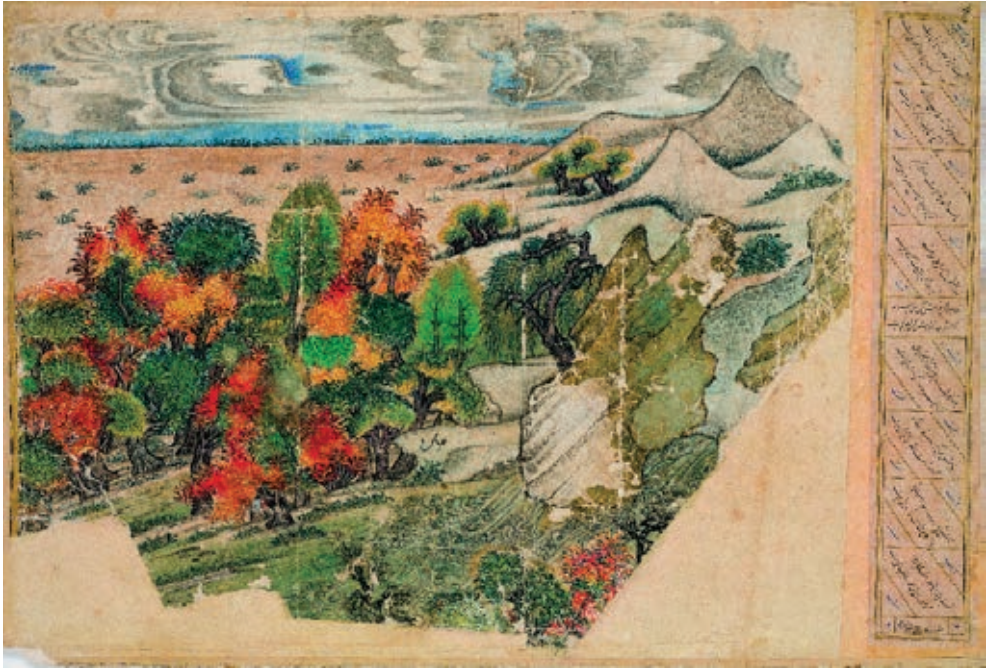
Resim 15. Sonbahar manzarası, Saray Albümü, Tebriz (?) XIV. yüzyıl ilk çeyreği, TSK, H. 2153, y. 68a (Atbaş, 2019, fig.17).

olduğu gibi, fırçayla yapılmış çizginin ifade gücüne dayalı bir üsluptadır. Zemin boyanmamıştır. “Kalem-i siyahı” tekniği ile çizilen resimde kırmızı, mavi, uçuk hâkî ve siyah mürekkep kullanmıştır. Albümdeki bir diğer resim, Çin sanatının güçlü etkilerinin hissedildiği sonbahar manzarasıdır (Resim 15).