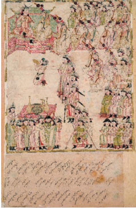
Resim 14. Saray'da tören, Tebriz (?) XIV. yüzyıl ilk çeyreği, Saray Albümü, TSK, H. 2153, y. 148b (Atbaş, 2019, fig.16).

H.2153 numaralı saray albümünde yer alan bazı resimler de Câmi'ü't-Tevârih 'in Moğol Hanları tarihi ile ilgili, günümüze ulaşmamış bir cildine aittir. Muhtemelen Reşîdüddîn'in Câmi'ü't-Tevârih adlı eserinin Moğol tarihini anlatan bölümü için hazırlanmış olan bu tür resimler, çift sayfalık kompozisyonlar halinde düzenlenmiştir. Moğol hanları için gösterişli tahta çıkma törenleri düzenlenir, bu törenlerde Hanın yanında eşi Hatun, hanın erkek kardeşleri ve oğullarının yanı sıra hanedanın diğer kadınları da yerini alırdı. Ayrıca törende üst rütbeli görevliler ve saray erkânından bazı kişilerde bulunurdu. Albümdeki resimlerden biri Moğol Sarayındaki bir töreni canlandırmaktadır (H.2153, 148b; Resim 14).