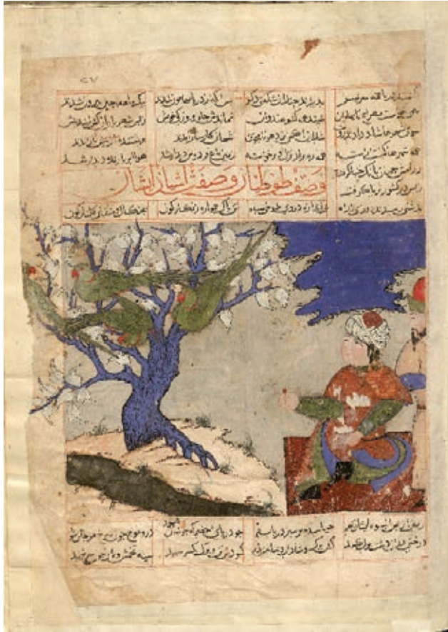
Resim 16. Papağanları seyreden Garşasp, Garşasname, Tebriz 1354, TSK, H. 674, y. 27a (Atbaş, 2019, fig.20).

koleksiyonunda olup el-Hac Hasan Rukneddin tarafından muhtemelen Tebriz’de 1354 yılında kopya edilmiştir (H.674). 91 yaprak olan eserin cildi özgün olmayıp mukavva kaplıdır. Günümüze ulaşmış en geç tarihli İlhanlı resimlerini içeren eserin birçok boş kalmış resim yerinden tamamlanamadığı anlaşılmaktadır. Eserin 27a sayfasındaki resimde, dere kenarında, yerde, kırmızı bir örtü üzerinde oturan Garşasp sol taraftaki ağacın dallarına konmuş, yeşil renkteki dört iri papağanı seyrederken betimlenmiştir (Resim 16). Figürlerin ve doğanın betimlenişindeki gerçeklik İlhanlı devri resim üslubunu yansıtmaktadır. 23