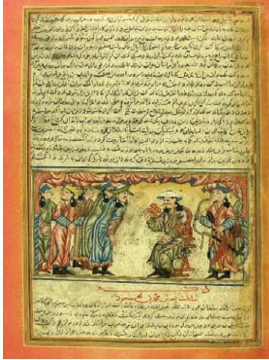
Resim 13. Sultan Mahmud, oğulları Muhammed ve Mesud ile sarayında, Câmi'ü't-Tevârîh , 1314, TSK, H. 1653, y. 301a (Atbaş, 2019, fig.15).

iki farklı döneme ait istinsah tarihinden biri ilk yazılış tarihini içerir ve 1-10 Ekim 1314 tarihinde Katib al-Hafız tarafından yazıldığı belirtilir. Diğer iki kayıt ise 18 Kasım 1425 ve Haziran 1426 tarihlerini içerir ve bu bölümlerin Hafız Ebru tarafından yazıldığı belirtilir. Timuri Sultanı Şah Ruh'un (1405-47) emriyle Timuri saray tarihçisi Hafız Ebru eserin eksiklerini tamamlamış ve Şah Ruh devrine kadar da uzatmıştır. Dolayısıyla eserin sonradan eklenen kısımlarının resimleri Timuri diğerleri ise İlhanlı üslubundadır. Kitabın Gazneli Devleti'nin tarihini içeren bölümünde yer alan, Sultan Mahmud'u ile oğulları Muhammed ve Mesud ve sarayındaki görevliler ile gösteren resim (Resim 13), Doğu Asya etkisini güçlü bir biçimde yansıtan özgün resimlerdendir. 19