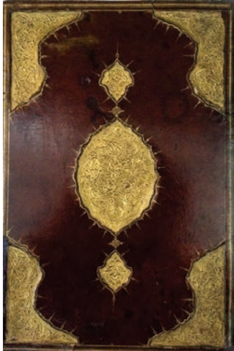
Resim 9. Kur'an cüzünün ön dış kapağı, 1282-83, TSK, E.H. 227 (Atbaş, 2019, fig.11).

Yâkût el-Mustasimî tarafından yazılan aynı ölçülerdeki Kur'an cüzünün de cildi ve tezhibi saray nakkaşhanelerinde yenilenmiştir (E.H.227). 1282-83 tarihli cüzün, bordo renkte deri dış kapakları dilimli madalyon şemse, salbek ve köşebentlidir. Zemini saz üslubunda bezenmiş ve altınla boyanmıştır (Resim 9). Aynı renkteki iç kapaklar ise yeşil, lacivert, turuncu renkte boyalı zemine, altınla boyalı oyma rumilerle bezenmiştir. Sayfada muhakkak hatla 5 satır halinde yazılmış olup 50 yapraktır. Serlevha tezhibi dikdörtgen formundadır. Sure araları altınla boyanmış, sarmal dallar üzerinde sıralanan renkli çiçek ve yapraklarla bezenmiştir. Üst ve alttaki dikdörtgen kartuşların oval madalyonlar yapılmış, lacivert zemin sarmal dal ve rumilerle doldurulmuştur. Bu alanları kuşatan dilimli üçgenlerle oluşturulmuş bordür sayfa kenarlarına uzayan lacivert renkte tığlarla sonlanır. Sayfa kenarında kalan boşluklara ise hatayi ve yapraklı sarmal dallardan oluşan halkâr süsleme yapılmıştır. 13