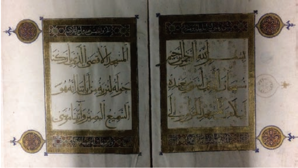
Resim 4. Kur'an cüzü, hattat: Ali b. Muhammed Zeyd b. Muhammed, Musul 1306-7, TSK, E.H. 232, y. 1b-2a (Atbaş, 2019, fig.6).

İç kapaklar kâğıt kaplıdır. 1a yaprağında Sultan III. Osman'ın (1754-57) vakıf mührü basılıdır. Altınla ve muhakkak hatla yazılmış olan 61 yapraklık bu eser, özgün cildinin yanı sıra, Kur'an yazımcılığının gelişimine ışık tutan yazımıyla da önemlidir (Resim 4). Altın ağırlıklı geometrik tezhiplerle süslü bu Kur'an cüzlerinin hattatı tarafından tezhiplendiği ve Ölceytü Hüdabende'nin kendi türbesi için hazırlattığı düşünülmektedir. 7